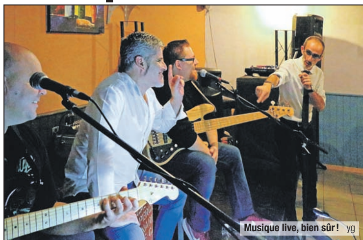
Musique live, bien sûr! yg