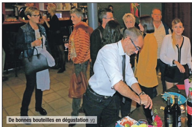
De bonnes bouteilles en dégustation yg

Pour de nombreux convives ce fut l'occasion d'apprécier une nouvelle fois l'ambiance particulière de ce lieu très sympathique et la qualité indéniable du service et des produits qui y sont proposés.