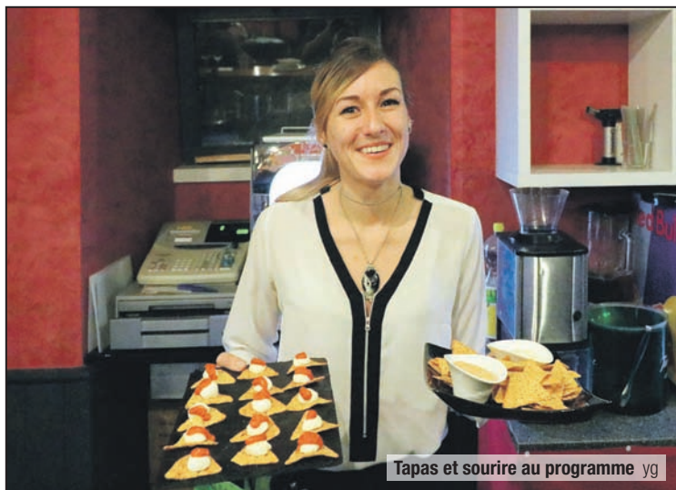
Tapas et sourire au programme yg