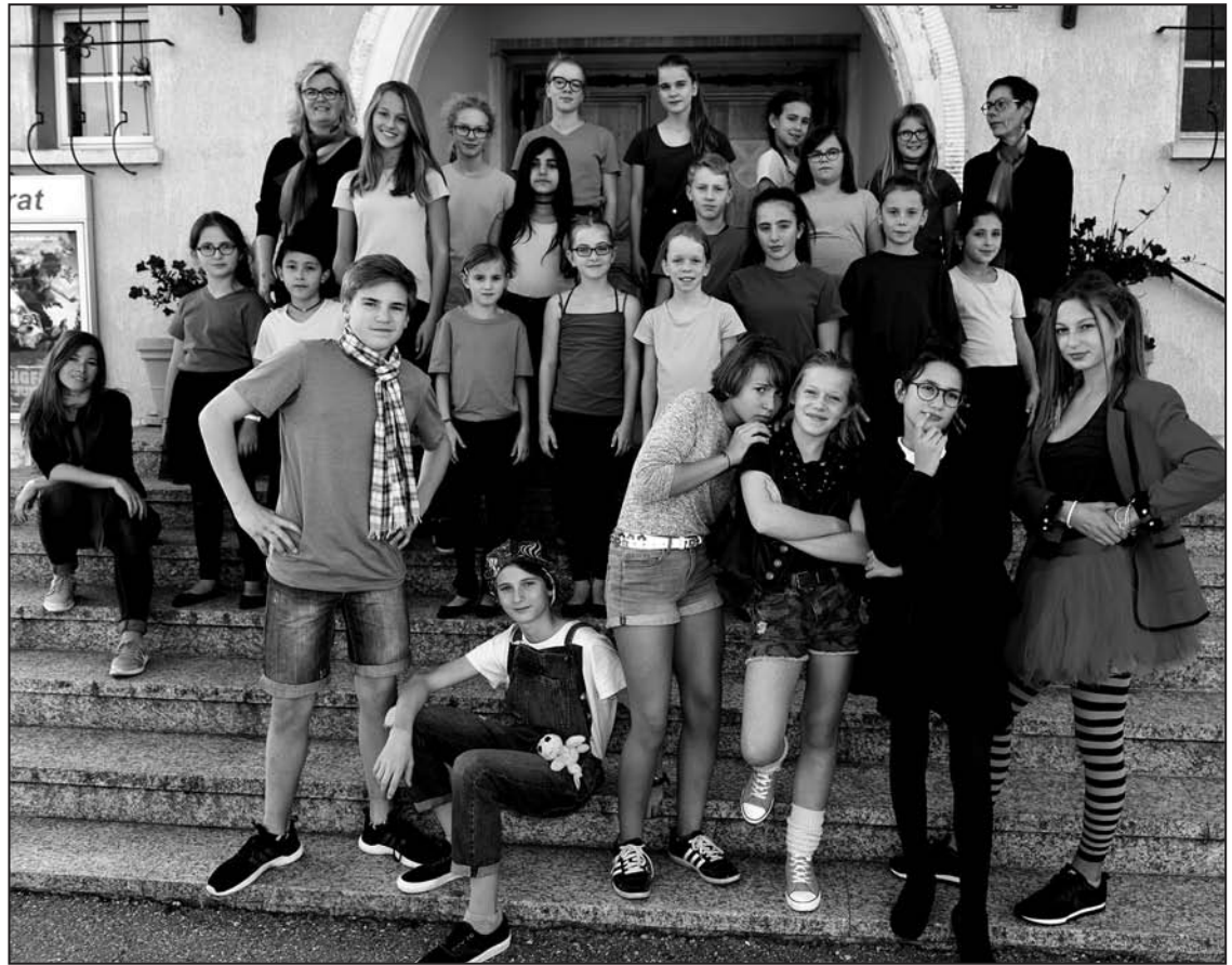
Le Petit Chœur de Carrouge

«J'ai trouvé cette histoire très belle et d'actualité. Les enfants cherchent entre eux des solutions pour contrer la pollution qui étouffe notre planète. Des moments de découragement, de joie, d'interrogation qui sont finalement le quotidien