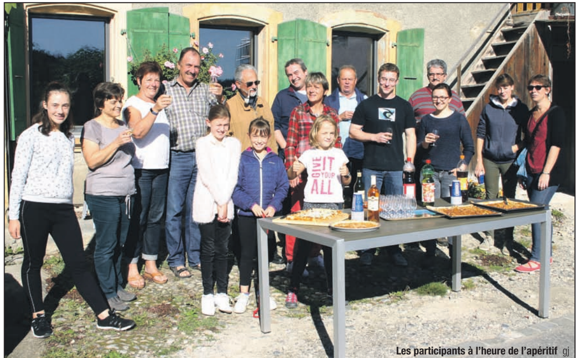
Les participants à l'heure de l'apéritif