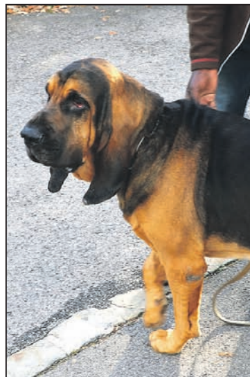
Le St-Hubert, un chien lourd et massif yg

A noter qu'au cours de cette semaine, une conférence destinée au grand public a été organisée dans les locaux du cinéma de Carrouge et qu'elle a réuni un public relativement important d'intéressés et de curieux.