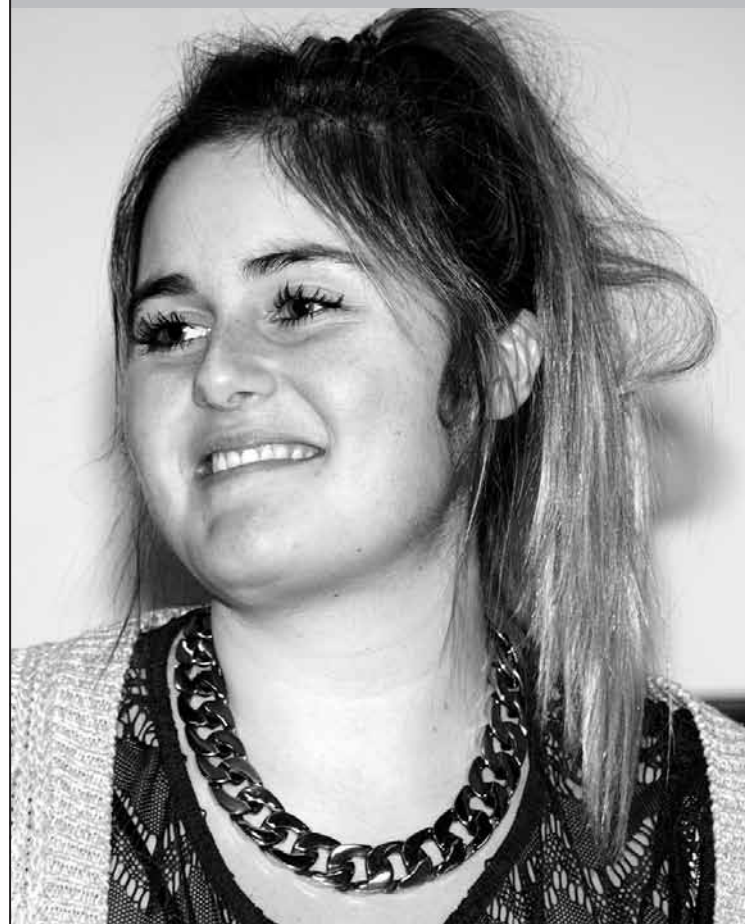
«Une bonne humeur contagieuse»