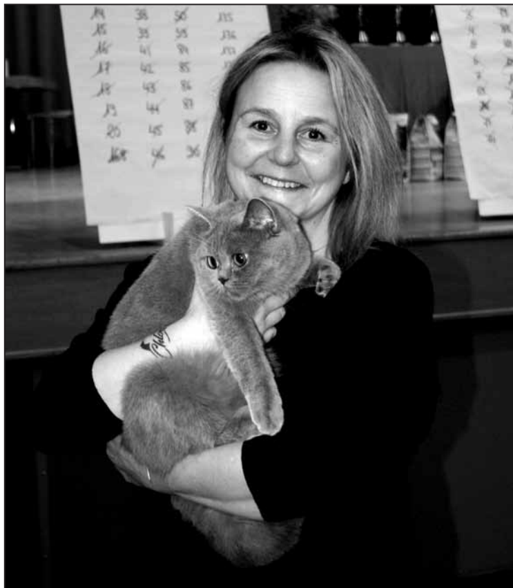
Rihanna, British shorthair

Le samedi 24 et le dimanche 25, la Grande Salle de Lucens a accueilli les éleveurs de chats de race et les très nombreux amis de la gent féline.