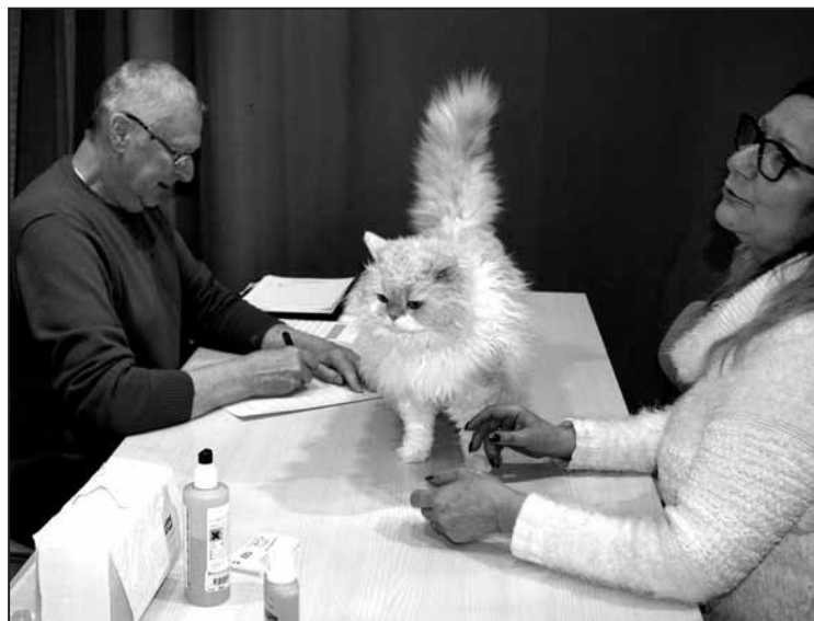
Le passage devant le juge