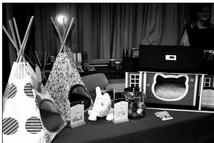
Des niches à chat