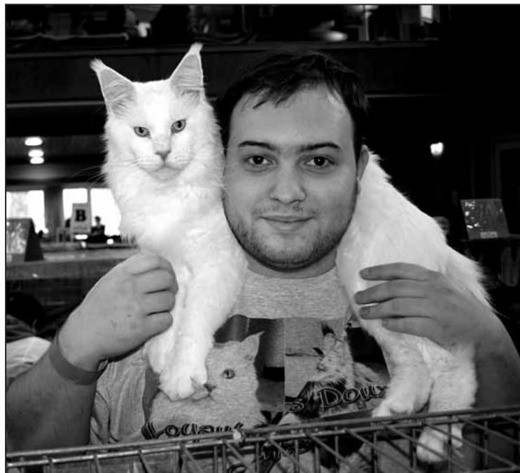
Fier de présenter Midnight , Maine Coon blanc