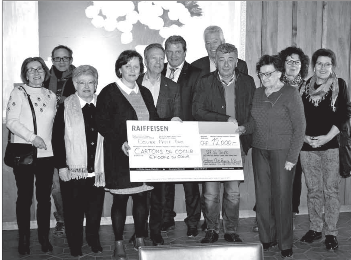
La remise du chèque

Le 16 décembre dernier, les membres du Rotary-Club Payerne La Broye ont effectué une action sociale en faveur des déshérités de la région.