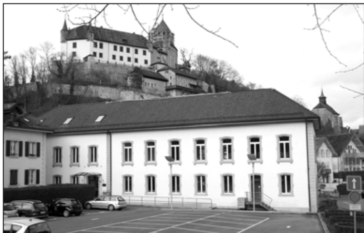
Le centre paroissial de Lucens