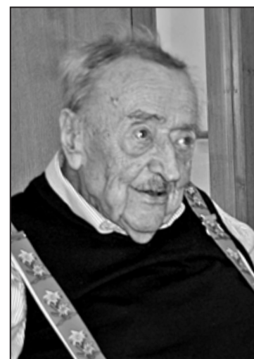
Un nonagénaire heureux