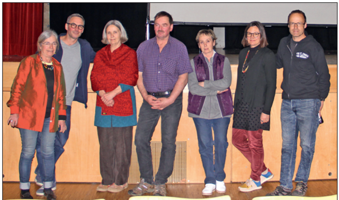
Les responsables du Film Vert à Moudon