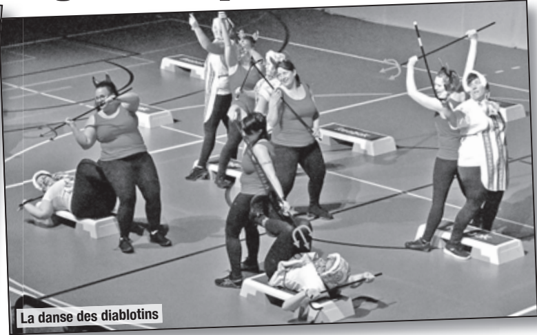
La danse des diabolos

• C'est dans la salle du Raffort à Mézières que, vendredi et samedi 15 et 16 mars derniers, la Société de gymnastique de Corcelles-le-Jorat a su enchanter une foule de