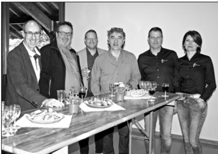
Une partie des exposants