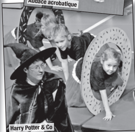
Harry Potter & Co