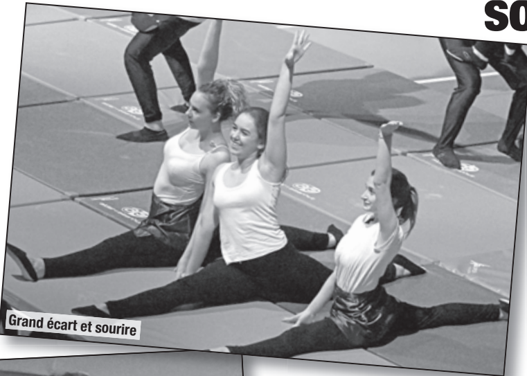
Grand écart et sourire