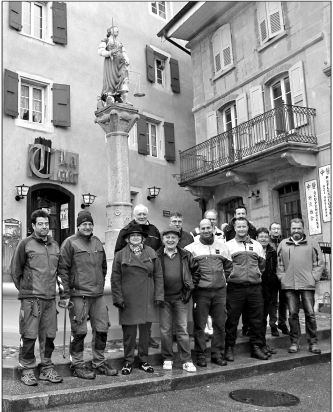
Les intervenants de la rénovation de la fontaine

La commune a profité de cette opération pour rafraîchir le bassin. Datant de 1872, celui-ci était fissuré à de multiples endroits. L'extérieur comme l'intérieur du bassin ont donc subi un traitement à la résine synthétique. Une touche de peinture