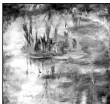
Huile sur panneau