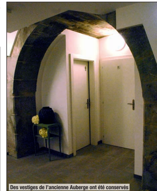
Des vestiges de l'ancienne Auberge ont été conservés