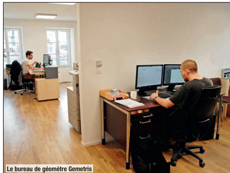
Le bureau de géomètre Gemetris