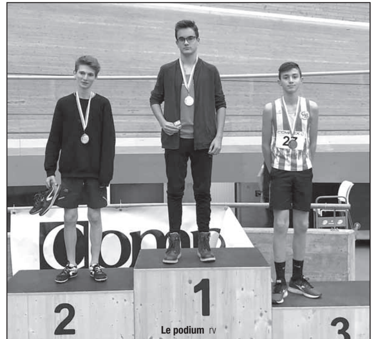
Le podium tv