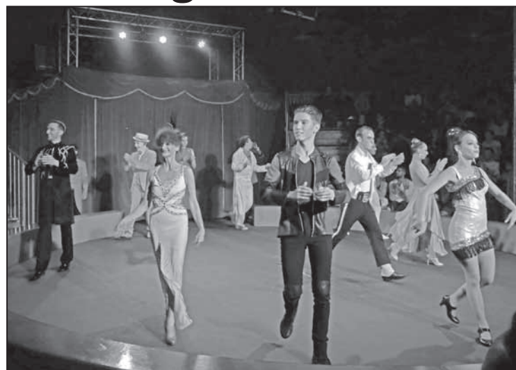
Les artistes du cirque