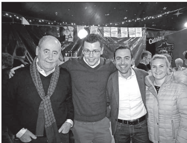
La Direction du Garage De Blasio