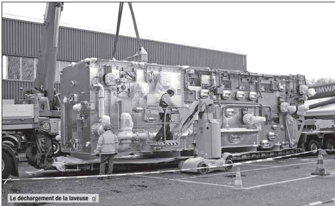
Le déchargement de la laveuse gj

• Rien de commun avec une machine à laver la vaisselle du ménage, mais un monstre d'une largeur de 4,2 mètres, d'une hauteur de 4 mètres et d'une longueur de 10 mètres. Transportée en convoi spécial depuis le nord de l'Allemagne, la machine a été déchargée par deux grues mobiles qui l'ont déposée devant l'entrée, avant de la pousser dans le bâtiment. Un travail rondement mené et parfaitement exécuté. Cet ouvrage s'inscrit dans un plan d'investissement de 25 millions de francs, un montant jamais réalisé jusqu'ici dans une usine d'embouteillage. Nestlé Waters a déjà investi plus de 48 millions de francs dans ses sites, son domaine et ses installations. Dans le cadre de son projet H2Orizon 2020, l'entreprise entend répondre aux attentes des consommateurs et anticiper les futurs besoins de la future production.