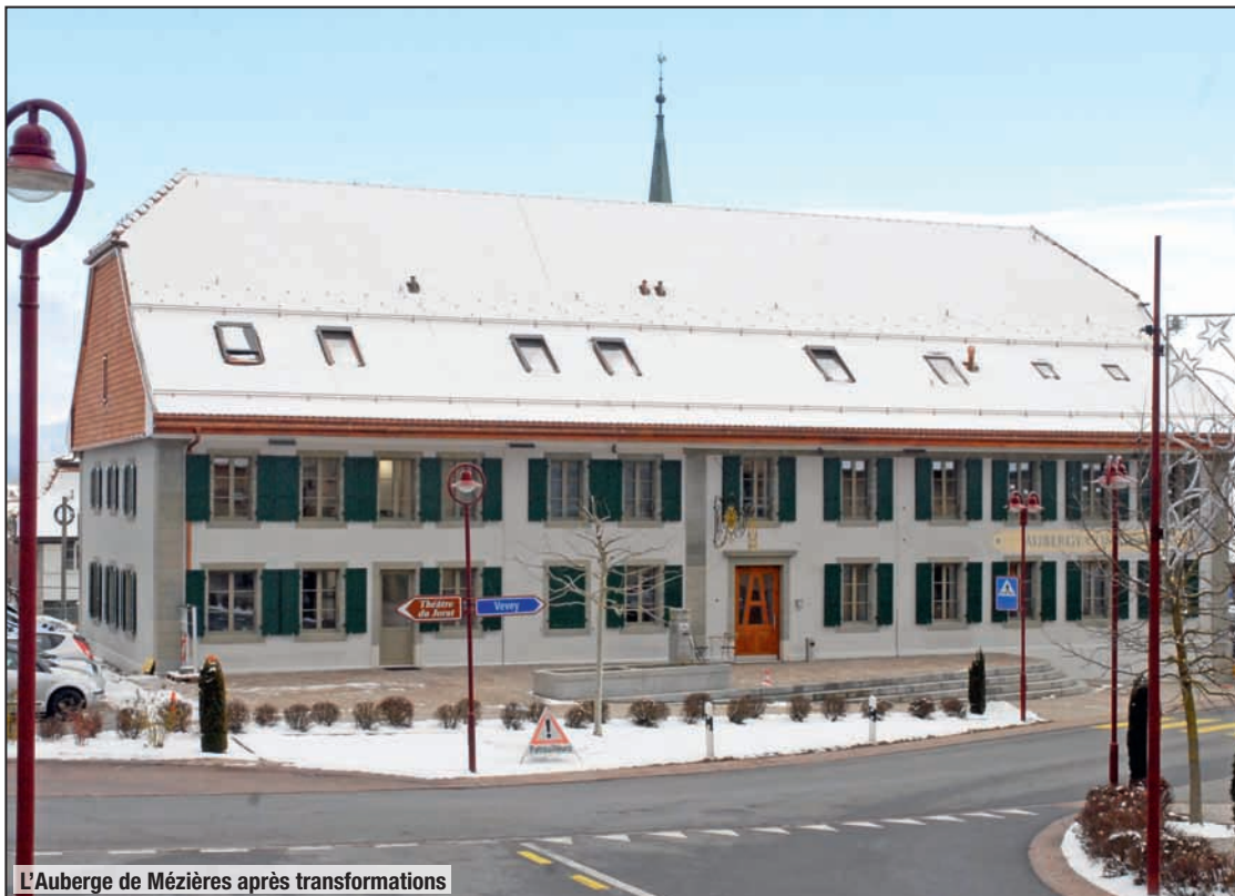
L'Auberge de Mézières après transformations

Si l'aspect extérieur n'a heureusement pas été modifié (cette maison est classée en catégorie 3 par les Monuments historiques), les quidams peuvent se demander où sont passés les 5,55 millions de francs qu'a coûté la transformation approuvée par le Conseil communal? Les façades n'ont pas changé d'aspect, si ce n'est la superbe enseigne rénovée à la feuille d'or par l'encadreur de Mézières Anthony Guyot. Les fenêtres gardent leur aspect original et la porte d'entrée principale conserve son cachet. Seuls les abords extérieurs ont été modifiés. La charpente et les façades extérieures sont d'origines. A l'intérieur, deux ou trois vestiges rappellent ce qu'ont été ce bâtiment et cette auberge. L'entreprise Gemetris vient d'y installer ses locaux sur près de 250 m 2 . Ce bureau d'ingénieurs géomètres brevetés compte 15 employés et a de la place pour une 16 e personne. L'ingénieur Ludovic Peguiron (44 ans) en est le codirecteur. Il est aussi syndic de Bercher. Son entreprise s'est fondue avec le bureau Rémy Stuby, ingénieur géomètre, bien connu dans la région, qui est encore son collaborateur. Gemetris occupe environ 35 personnes entre Chexbres et Mézières. Les employés se disent enchantés de leur nouveau cadre de travail et sont très satisfaits. Un appartement de 4 pièces et demie (loué) est aussi au premier étage.