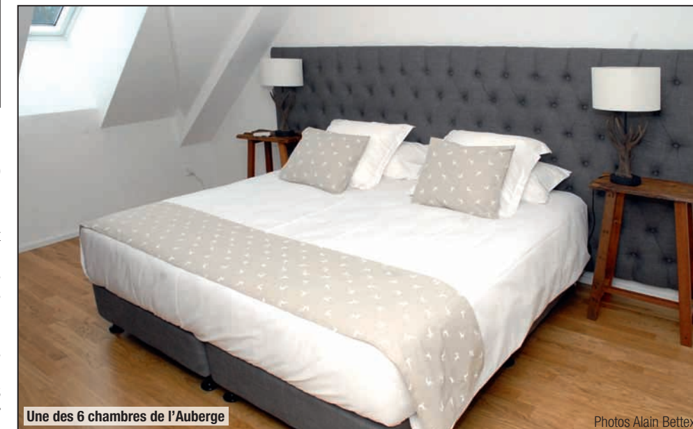
Une des 6 chambres de l'Auberge