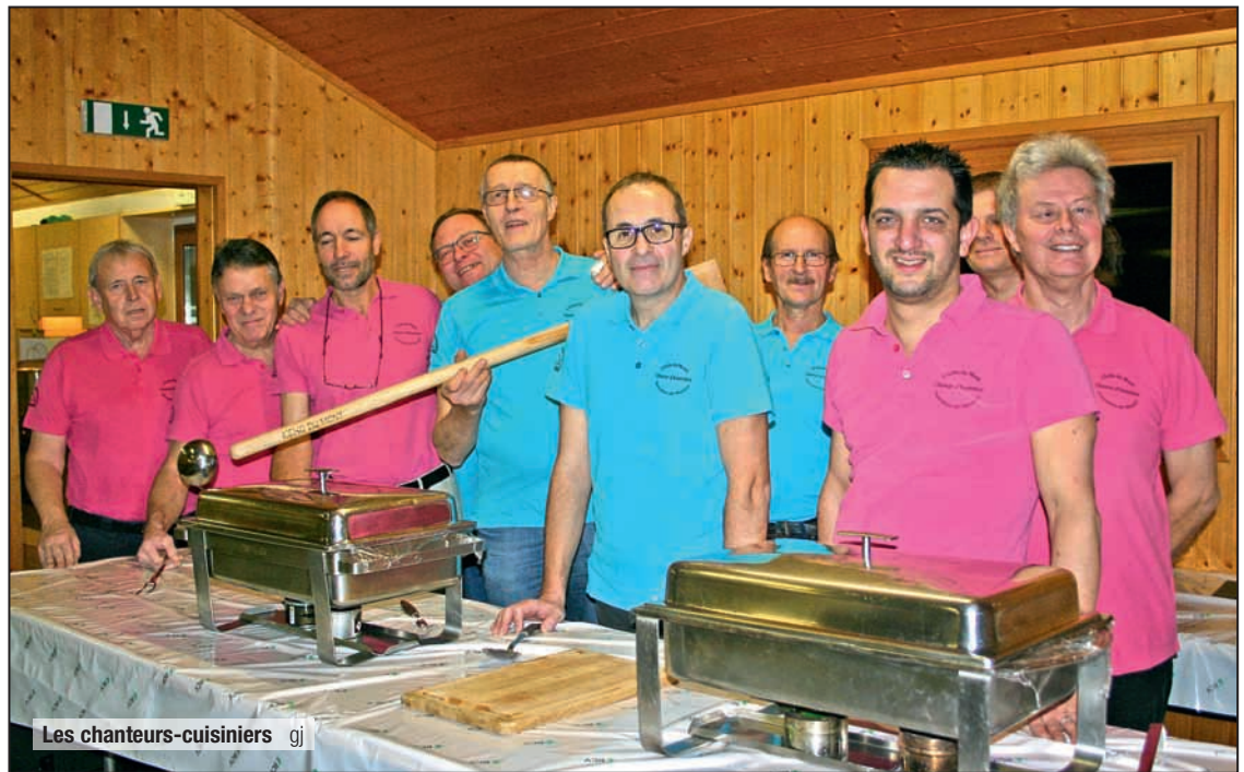
Les chanteurs-cuisiniers gj