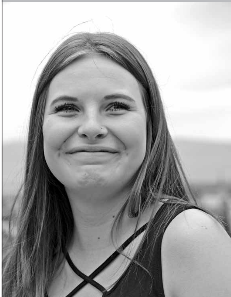
«Une bonne humeur contagieuse...»