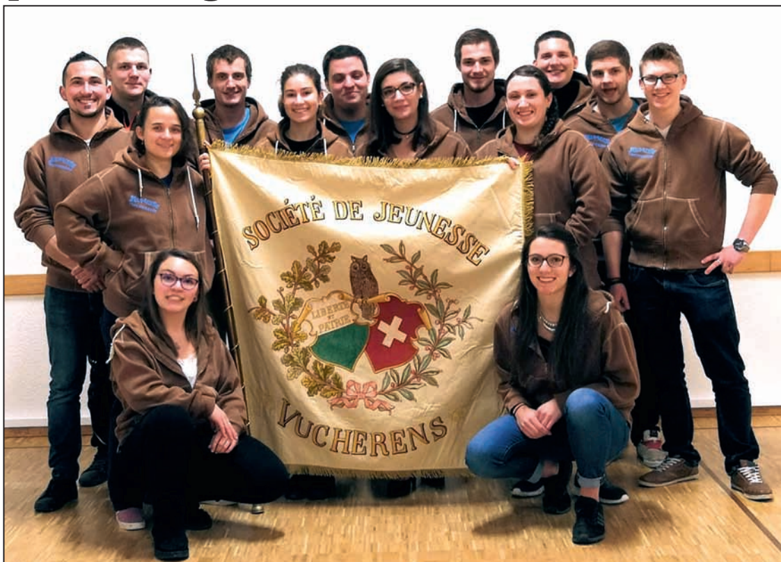
La Jeunesse de Vucherens

C'est aussi un projet qui intéresse toute une région, notamment la