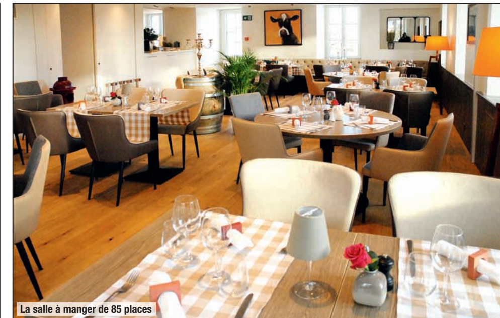
La salle à manger de 85 places