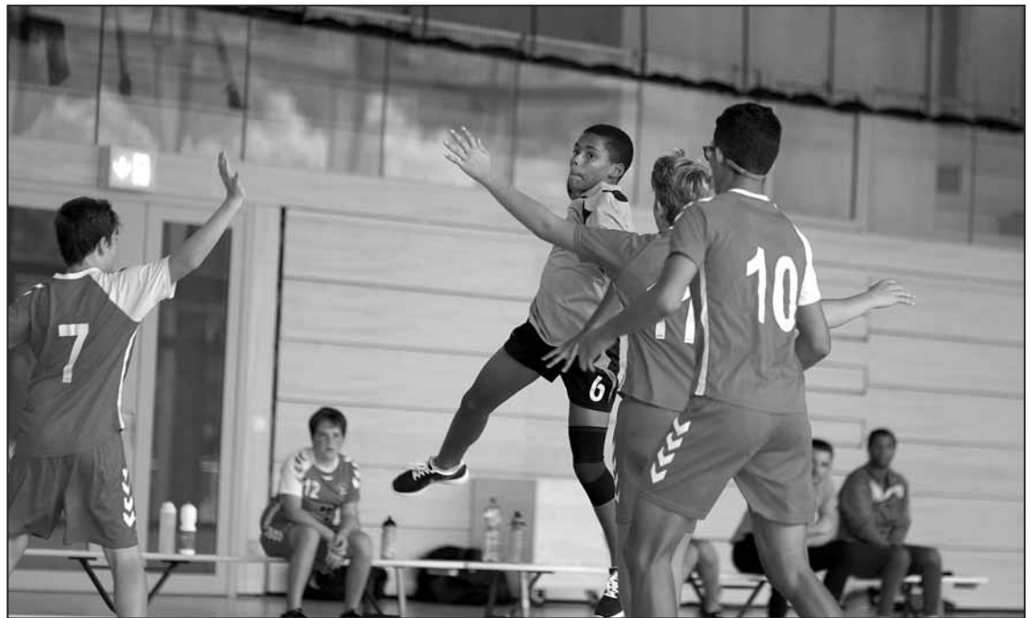
Les M15 entament bien leur deuxième partie de saison

La détermination étant d'autant plus forte que le match aller s'était soldé par une défaite d'un but seulement. Malgré un effectif réduit – avec seulement 2 remplaçants –, les hommes de Moudon ont très bien géré le match, avec des écarts de buts infimes. La jeunesse a égale-