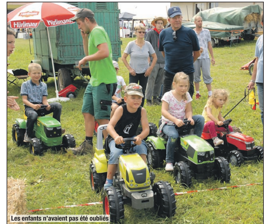
Les enfants n'avaient pas été oubliés