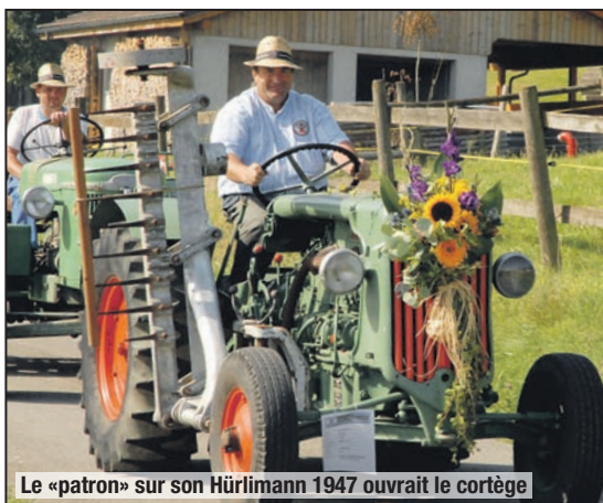
Le «patron» sur son Hürlimann 1947 ouvrait le cortège