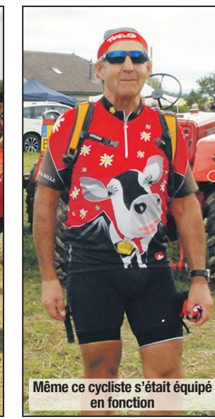
Même ce cycliste s'était équipé en fonction