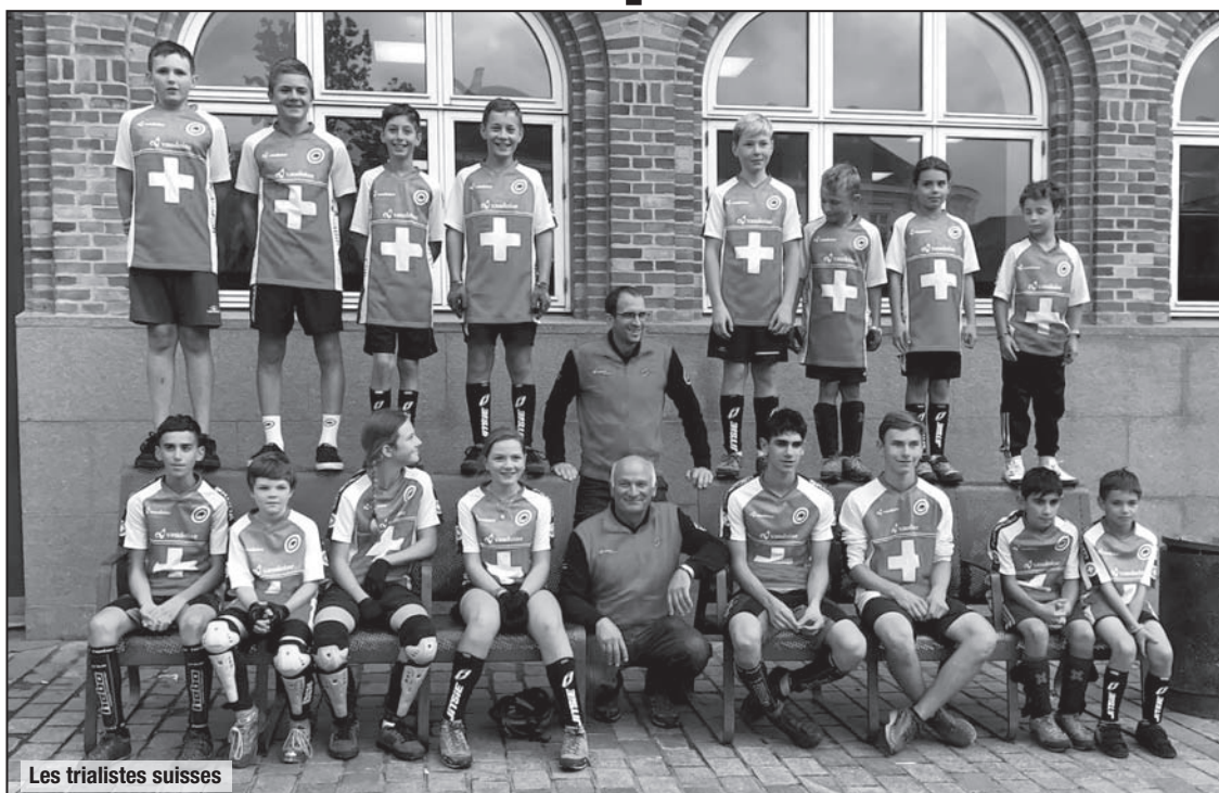
Les trialistes suisses

C'est donc une médaille en chocolat que les jeunes du Vélo Trial Broye Jorat (VTBJ) ont ramené dans leurs bagages. Mais, plus important que tous les trophées ou médailles, c'est que ces enfants sont rentrés avec la conviction et le plaisir d'avoir donné le meilleur d'eux-mêmes sous le maillot de leur équipe nationale.