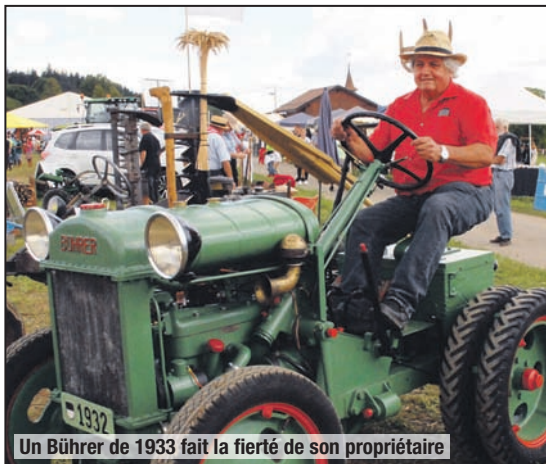
Un Bührer de 1933 fait la fierté de son propriétaire