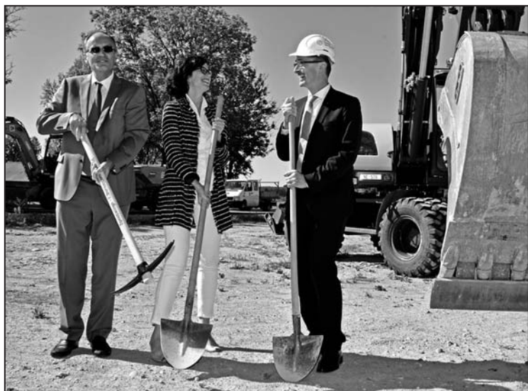
Le démarrage du nouveau chantier