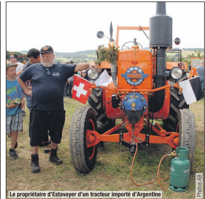
Le propriétaire d'Estavayer d'un tracteur importé d'Argentine