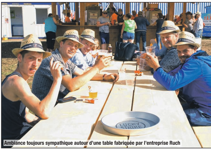
Ambiance toujours sympathique autour d'une table fabriquée par l'entreprise Ruch