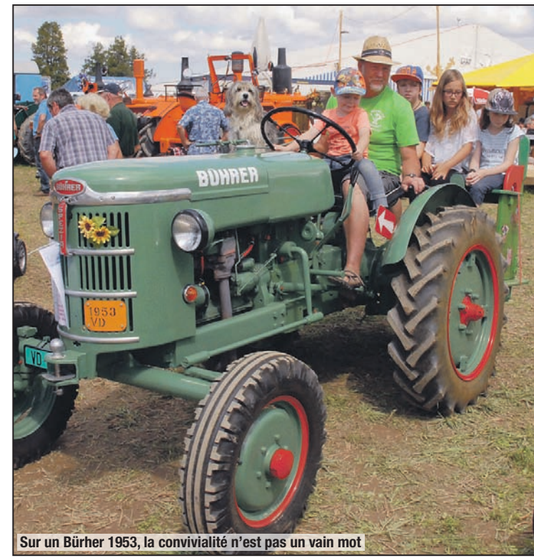
Sur un Bührer 1953, la convivialité n'est pas un vain mot