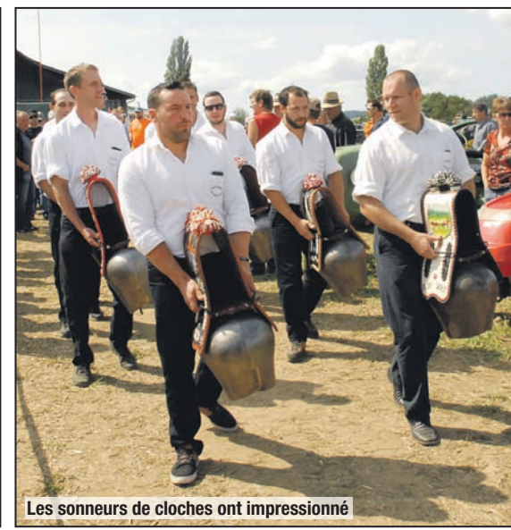
Les sonneurs de cloches ont impressionné