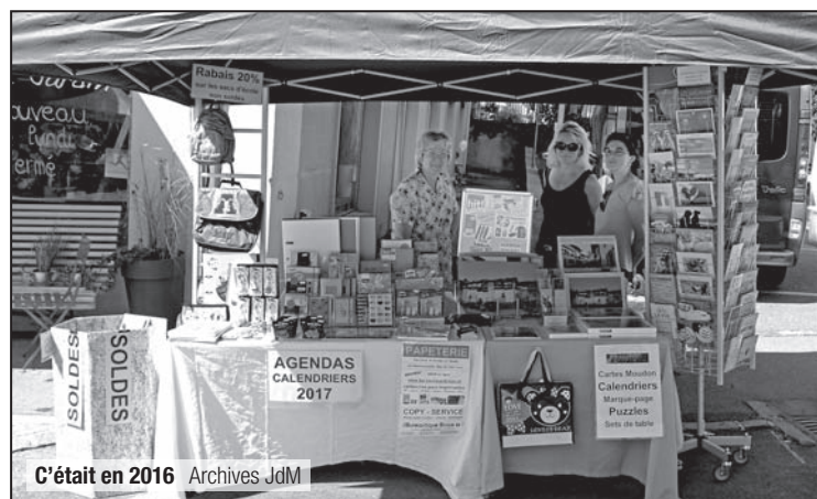
C'était en 2016