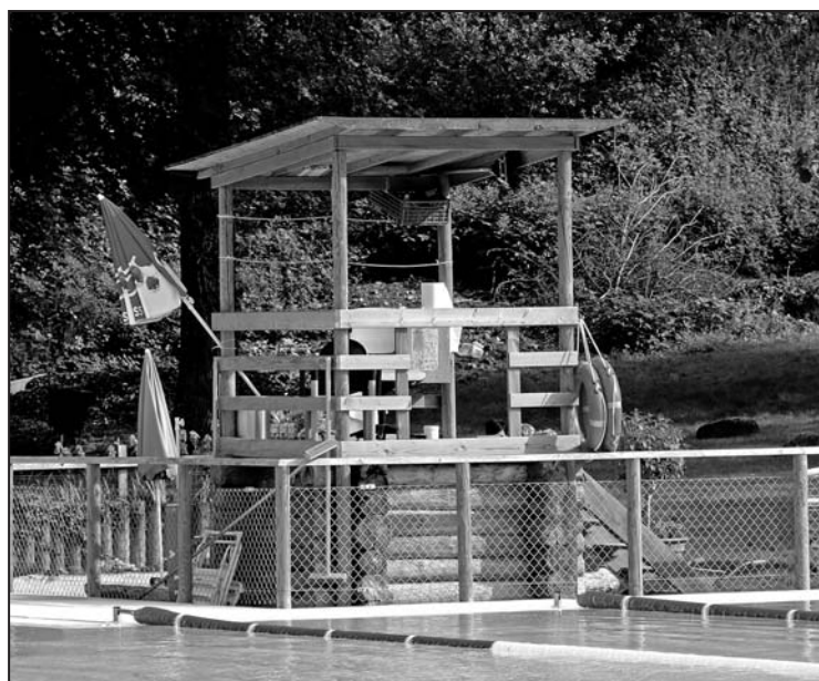
Les bassins ferment dimanche soir mais le restaurant reste ouvert

On peut aussi affirmer que les travaux d'aménagement, de modernisation et de mise en valeur de l'environnement effectués au cours des