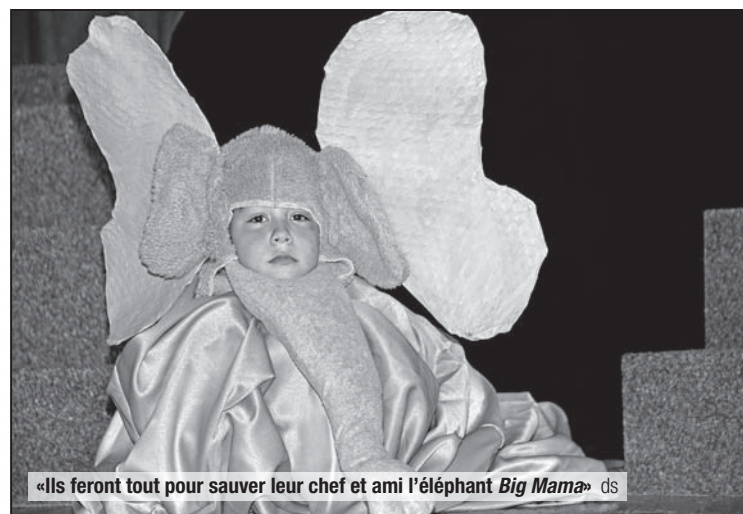
«Ils feront tout pour sauver leur chef et ami l'éléphant Big Mama » ds