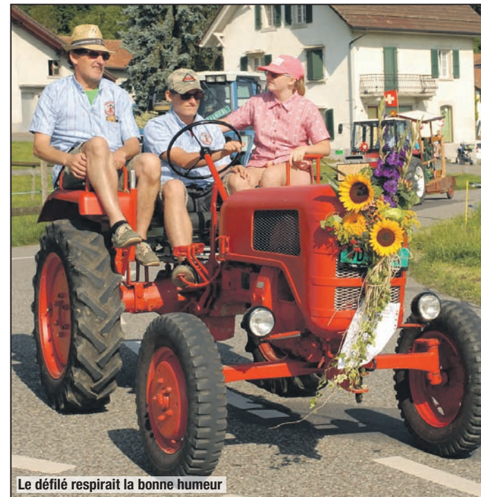
Le défilé respirait la bonne humeur