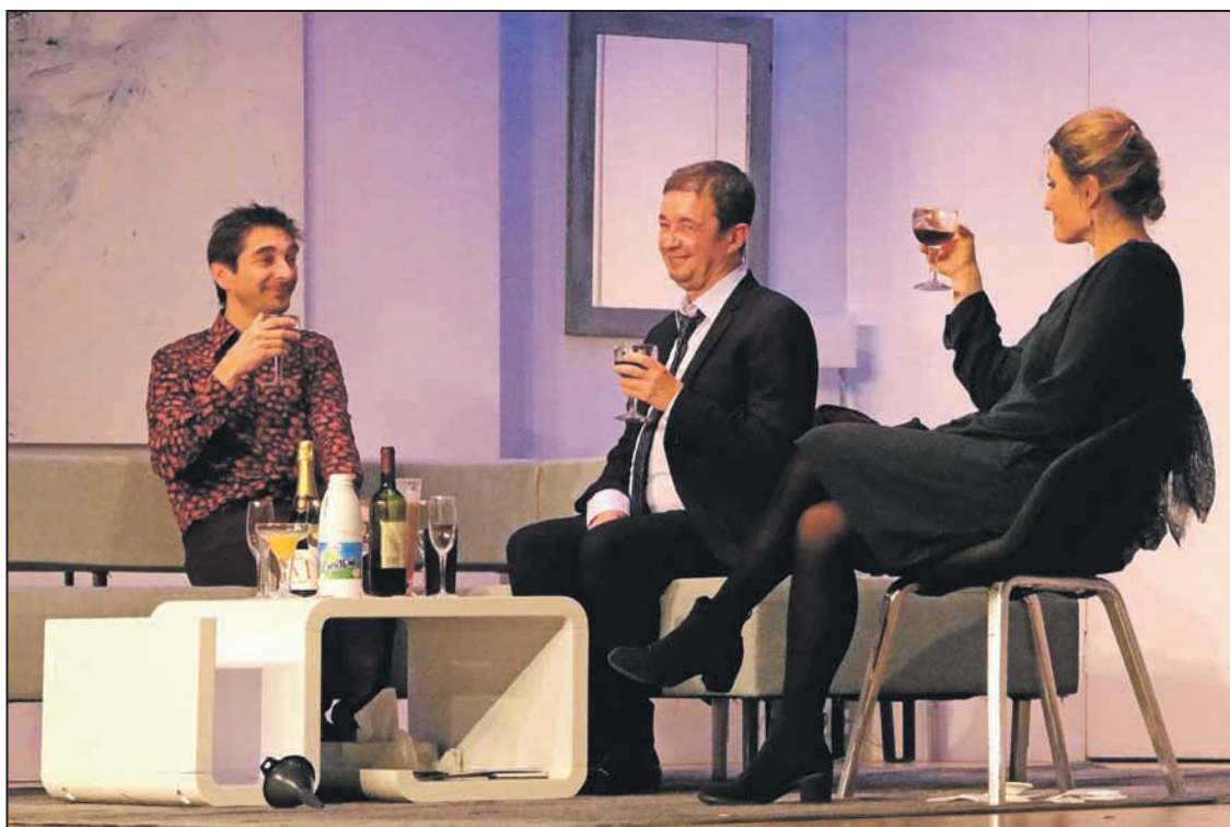
Sourires de faux-jetons!