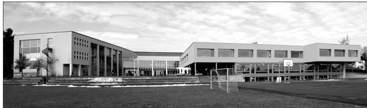
Le collège du Raffort avec son adjonction