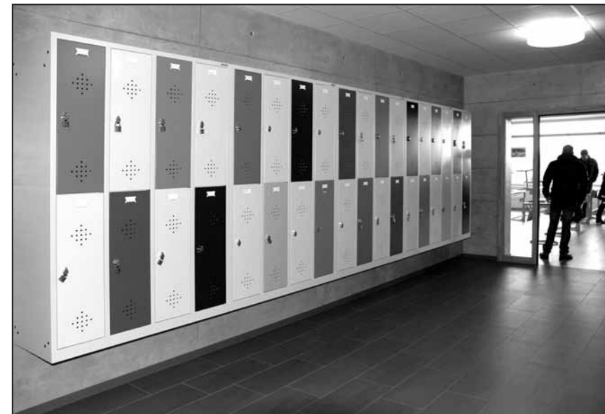
Des casiers pour chaque élève

Il est à souhaiter que les élèves de ce collège trouvent dans leurs vies familiales et professionnelles les mêmes conditions qui étaient les leurs durant leurs études au collège du Raffort. [Alain Bettex]