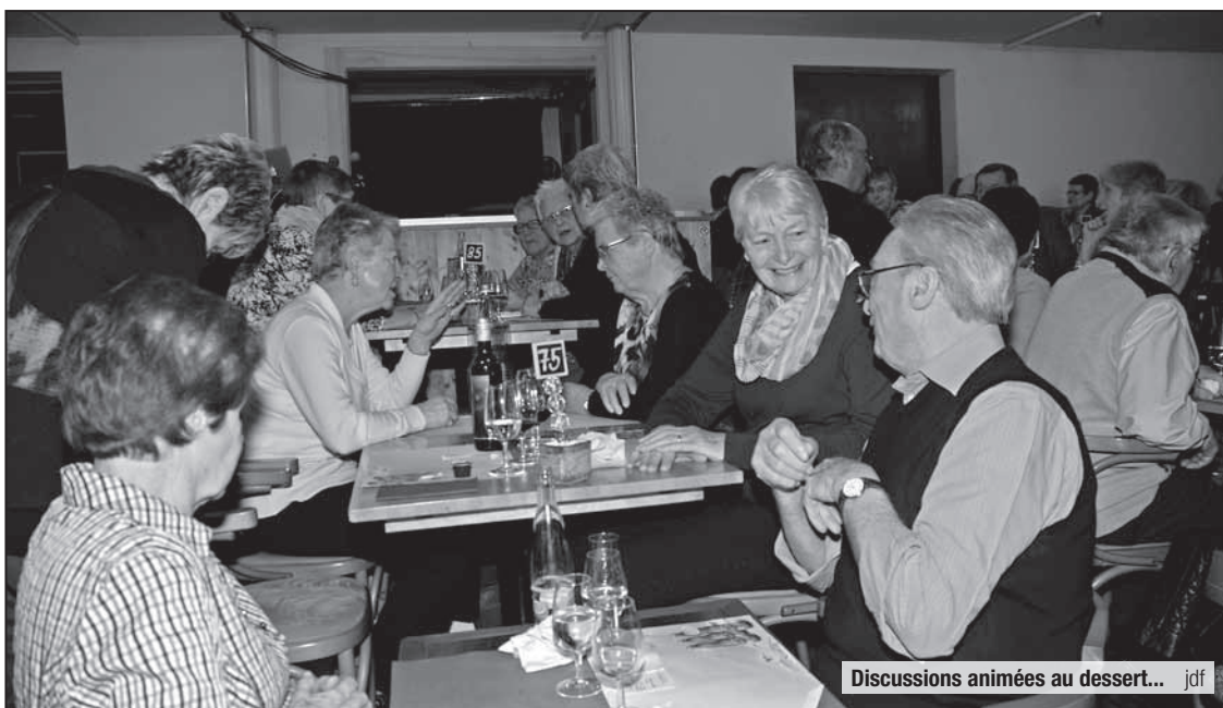
Discussions animées au dessert... jdf

• 180 membres broyards de la Fédération vaudoise des retraités (FVR) ont, dimanche 12 février, fêté les 20 ans de la section régionale dans la joie. A l'initiative de leur comité, ils ont partagé un succulent repas puis le spectacle drôle, rythmé et coloré de la Revue de Servion, au café-théâtre Chez Barnabé. Fondée à Moudon en 1997, la section FVR Broye-Vully recense à ce jour 450