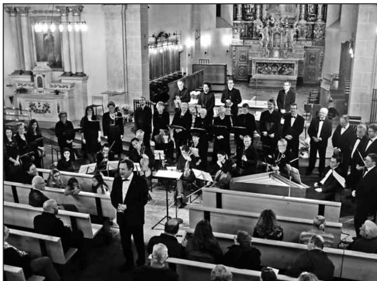
L'ensemble choral «Gioia Cantar»

Notre équipe d'organisation s'attache à faire vivre, sur le plan culturel aussi, l'église St-Etienne et nous remercions chacun, chacune de l'in-