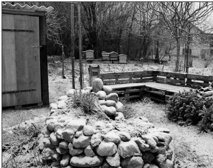
Le verger-potager en permaculture

Mardi au vendredi: 9h00 - 12h00 et 15h00 - 18h00 Samedi: 10h00 - 16h00 Fermé dimanche et lundi