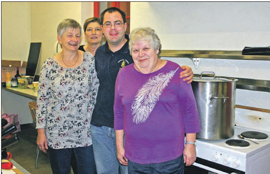
La Baronne et ses aides de cuisine