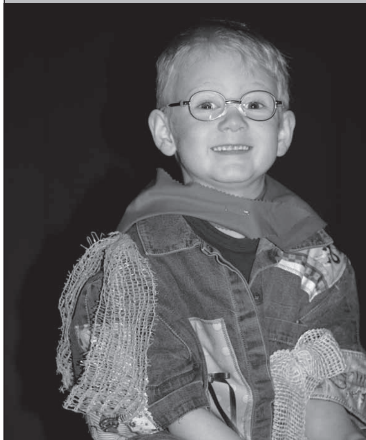
«Une bonne humeur communicative»