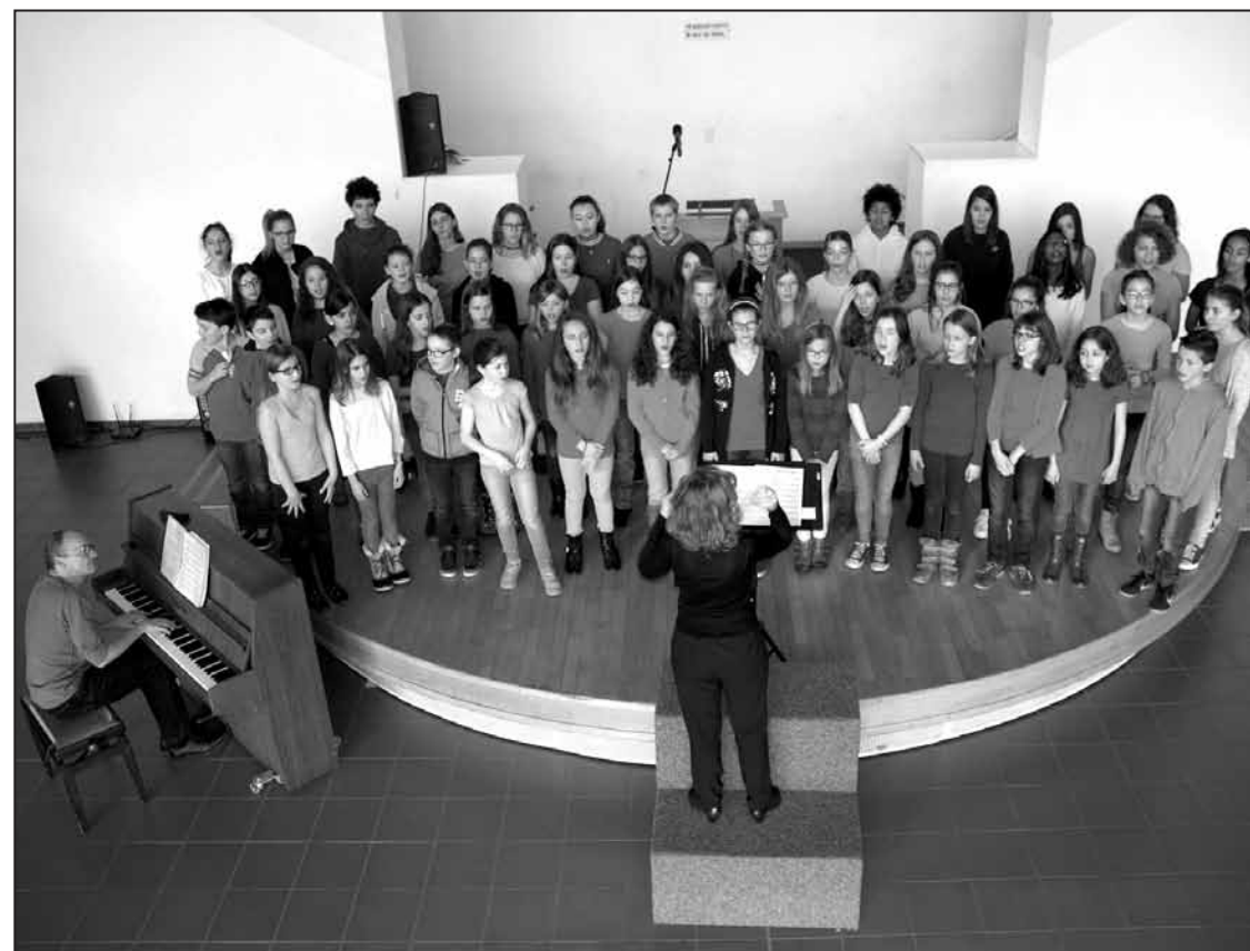
Le chœur des écoles du Raffort