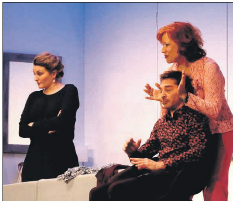
Une famille normale?

Bref, on a vécu là un excellent moment de théâtre de boulevard auquel le public conquis a fait un véritable triomphe. Décidément, la saison théâtrale moudonnaise 2016-2017 est exceptionnelle, bravo!