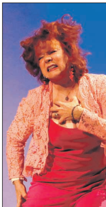
Eva Darlan déchaînée