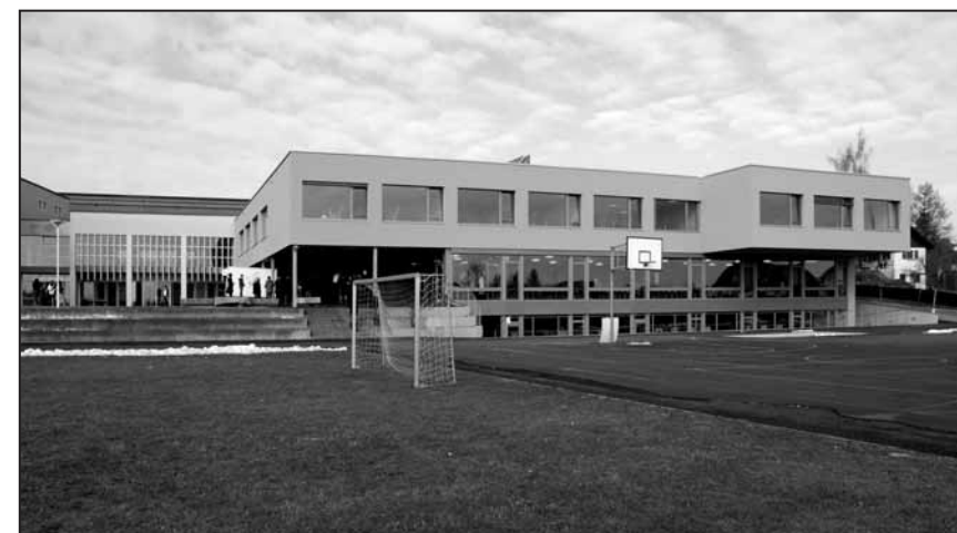
La nouvelle adjonction