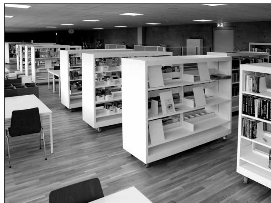
La bibliothèque ouverte au public