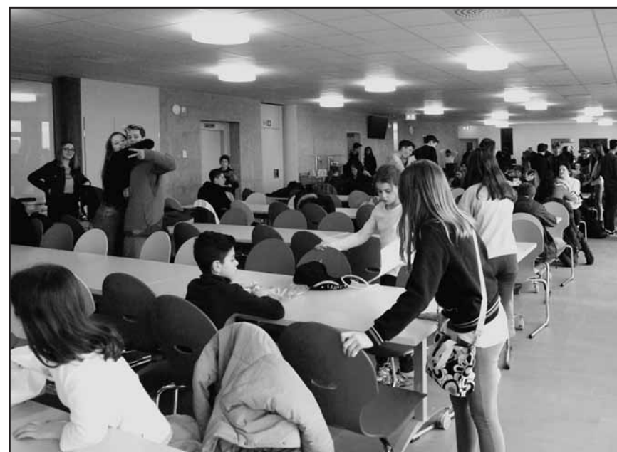
La cafétéria pouvant accueillir 180 élèves