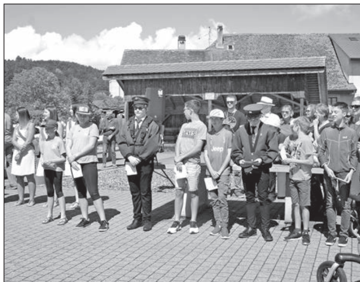
Les jeunes tireurs