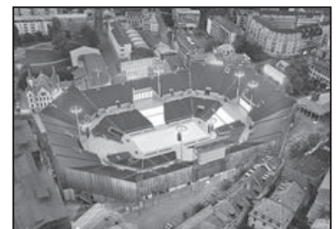
Le site de la future Fête des Vignerons