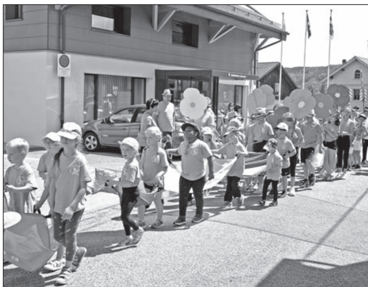
Les petits footballeurs en cortège