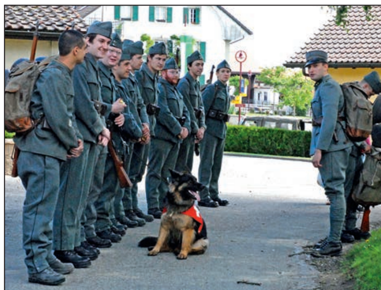
Prêts pour la marche