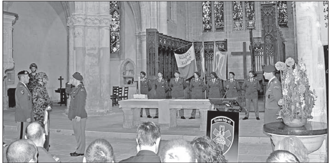
Les officiels ont félicité les nouveaux cadres militaires spécialistes en crises sanitaires

La cité moudonnaise, qui s'engage pour le maintien des formations cadres basées à Bressonnaz, célèbre chaque année au Temple St-Etienne la promotion des techniciens sanitaires de l'Armée. La cérémonie qui s'est déroulée dans 3 langues nationales a accueilli les familles des gradés venues des quatre coins de la Suisse. Agrémentés par la fanfare de l'ensemble musical d'Etagnières, une trentaine de lieutenants, dont une femme, ont été promis sous le drapeau suisse. Le commandant a félicité ces nouvelles responsabilités et encouragé ces jeunes promus à mobiliser les valeurs qui feront d'eux de bons chefs. La gestion des troupes sanitaires en cas de crise repose sur des valeurs authentiques et un esprit de cohésion. Des capacités mises à l'épreuve durant ces quatre semaines intenses de formation qui se sont achevées avec un exercice en taille réelle. 48 heures de marche avec bivouac et héliportage, une mise en condition réelle pour les troupes qui peuvent se féliciter d'obtenir leur grade au terme de ces semaines d'épreuves. Dans la ligne de mire, des exercices en lien avec la gestion du corps militaire en cas de catastrophe nucléaire. Des accidents qui frappent de plus en plus la conscience collective avec la série télévisée à succès Chernobyl qui plonge le spectateur dans le chaos de la gestion soviétique de l'accident nucléaire historique. L'exploitation depuis le mois dernier d'une centrale nucléaire flottante sur mer au