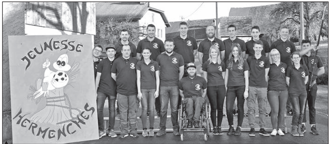
Les Jeunesses d'hier et d'aujourd'hui...

La journée de commémoration officielle aura lieu quant à elle le dimanche 30 juin avec un banquet et une partie oratoire. Tous les anciens membres de la Société ont été conviés afin de célébrer ce siècle d'existence et de faire honneur à ces