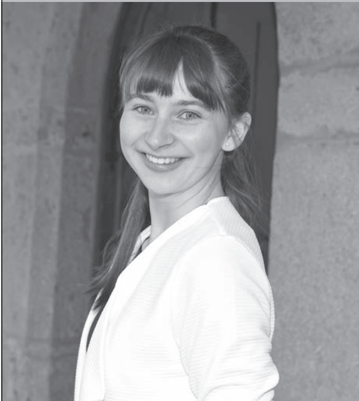
«La bonne humeur communicative»