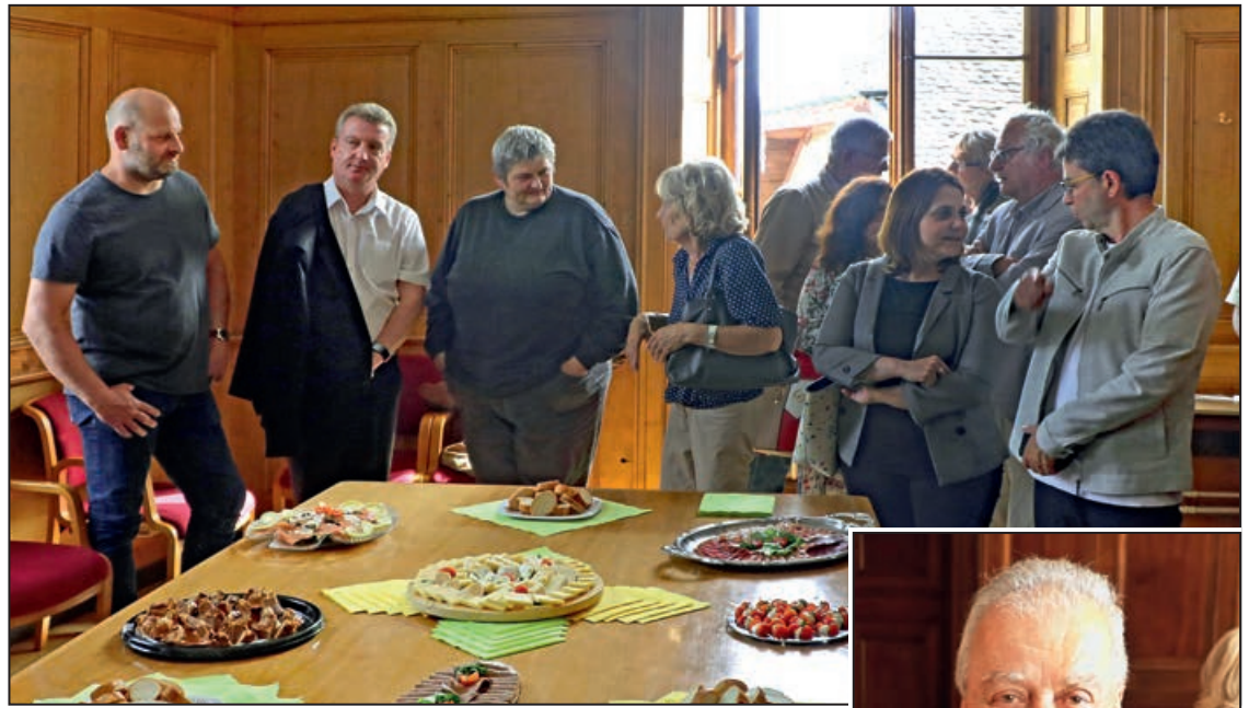
Vernissage de l'exposition