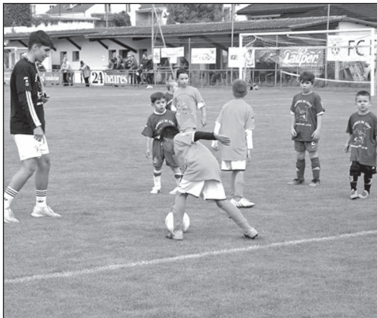
Les petits footballeurs

• Le samedi 15 juin dernier, les terrains de sports de Lucens ont reçu les juniors F dans le cadre des qualifications en vue de la finale du samedi 29 juin à Lausanne.