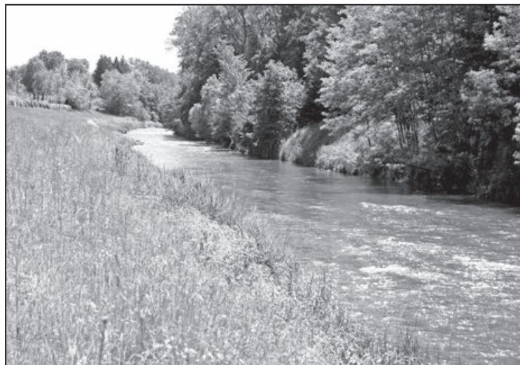
Le cours actuel