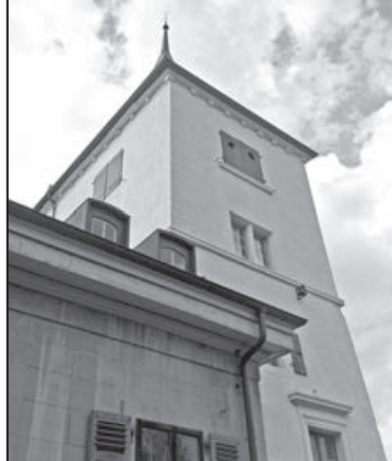
Le Château de Billens