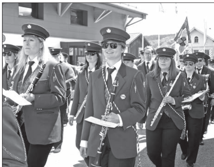
L'Harmonie La Broyarde