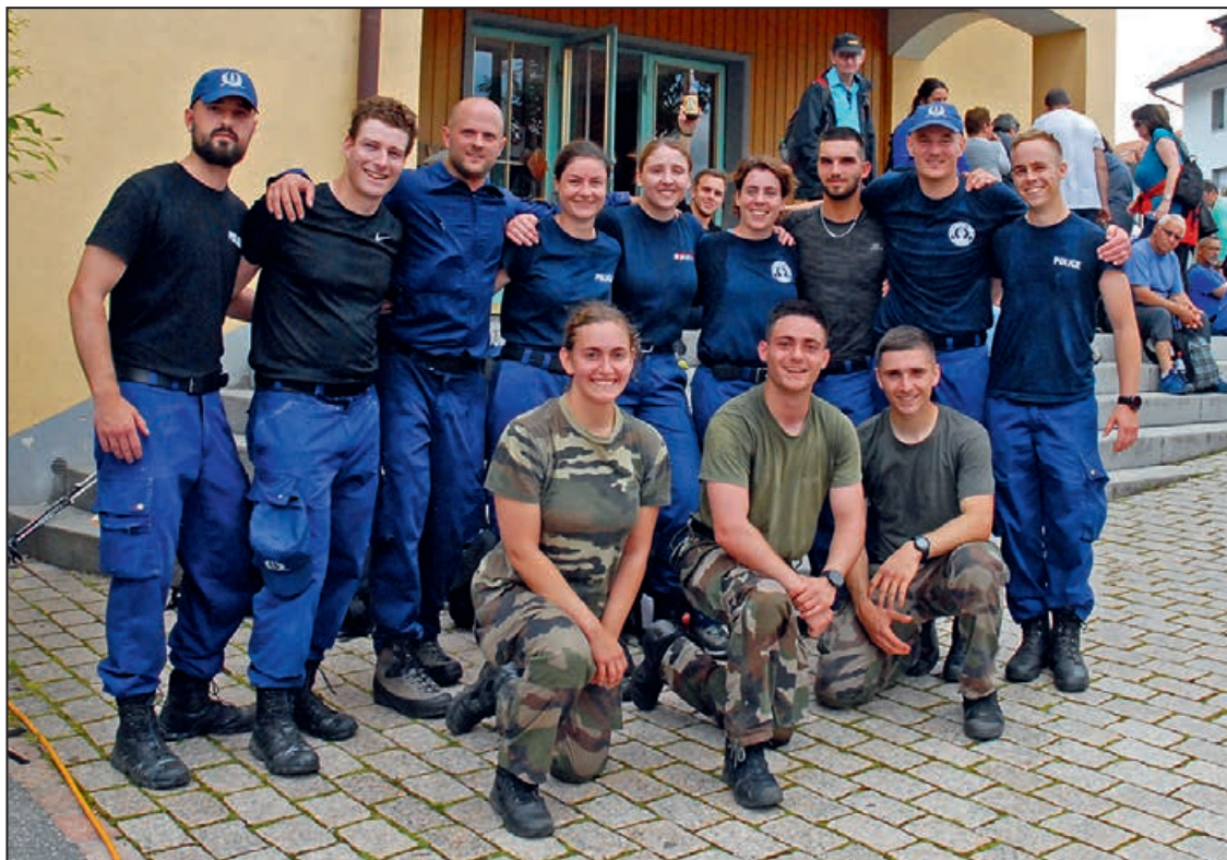
Les aspirants gendarmes à l'arrivée

Les participants avaient le choix entre 6 parcours: un de 7 km, 10, 16, 20, 30 et pour les plus volontaires, 40 km. En cours de route, à Vuibroye, une petite buvette et une place de pique-nique étaient prévues. Lors des fréquents postes de contrôle, du thé et du bouillon étaient à disposition des marcheurs, de même