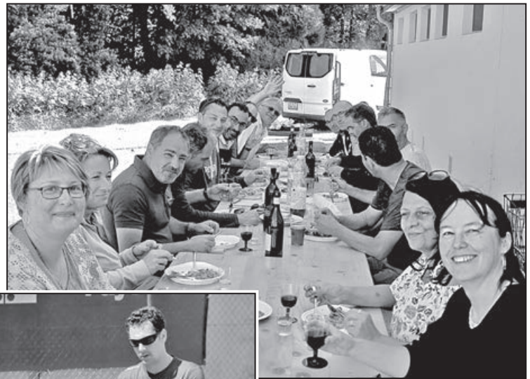
Un bon moment de convivialité

remonter un score défavorable ou pour empêcher leur adversaire de les rejoindre. C'est finalement sur le score net et sans appel de 7 à 0 que Lucens s'est imposé sous un ciel sans nuage, contrastant fortement avec l'orage qui a traversé notre région samedi en début de soirée. Le club de Lucens reste ainsi maître de son destin: deuxième du groupe derrière Montchoisi, il jouera la grande finale dimanche prochain le 23 juin chez l'actuel troisième, le TC Bière. Sachant que Montchoisi et Founex,